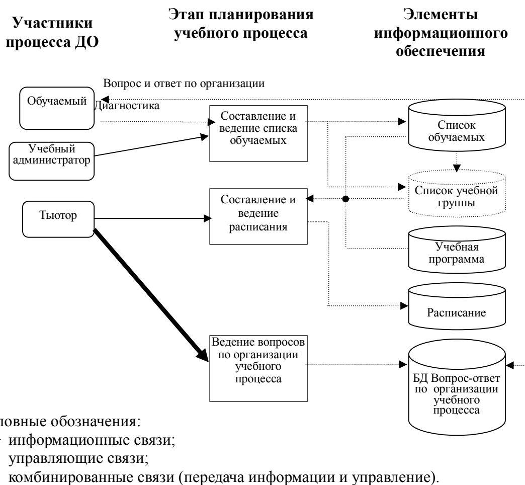
Рис. 1. Структура этапа планирования учебного процесса