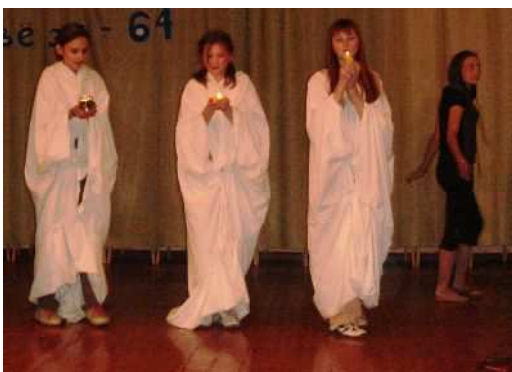
Школьный конкурс « Фабрика звёзд -64»