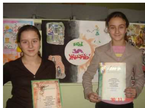
Конкурс « Открой свой мир»