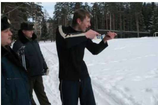
Военно- спортивная игра « Зарница»