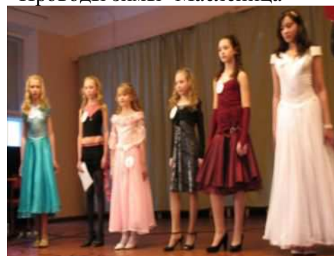
Школьный конкурс « Мисс школы»