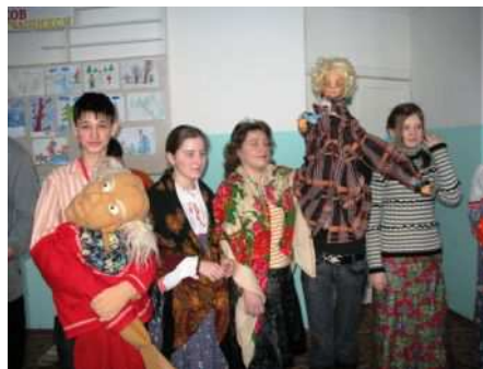
Проводы зимы- Масленица