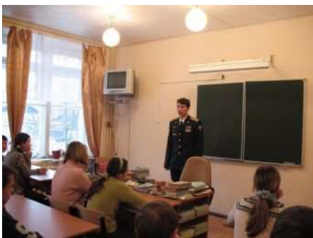
На уроке мужества офицер-лётчик